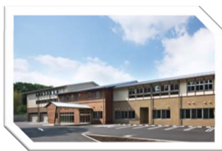
豊かな自然に囲まれています!