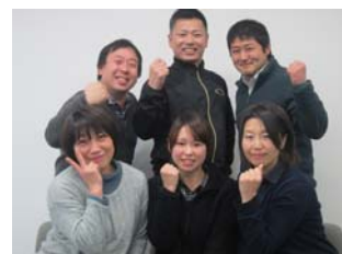
Kids たかはらスタッフ

わたしたちKidsたかはらスタッフは、そんな想いを持ったみなさまを一生懸命に応援します!